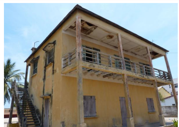
bât. administratif + apt de fonction à réhabiliter